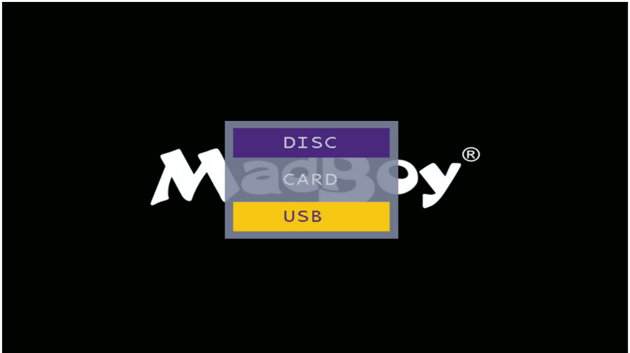
Kuva 3: USB-tilan valinta