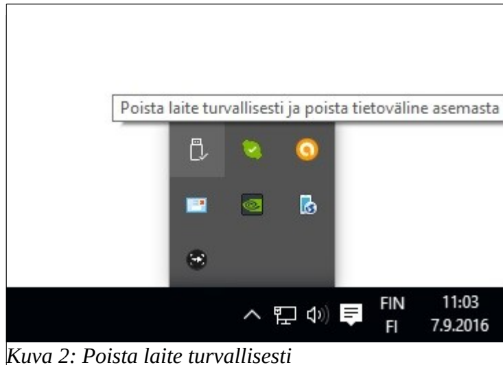
Kuva 2: Poista laite turvallisesti